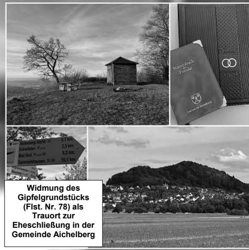
Widmung des Gipfelgrundstücks (Flst. Nr. 78) als Trauort zur Eheschließung in der Gemeinde Aichelberg

Für die Gemeinde Aichelberg und die Gemeinderäte Heike Schwarz Bürgermeisterin